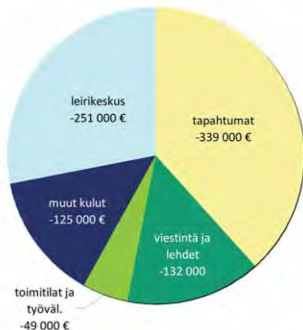
Tilinpäätöksen 2010 kulujen jakautuminen, kun henkilöstökulut on jaettu toiminnoittain