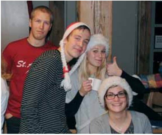
Julfest i Vasa