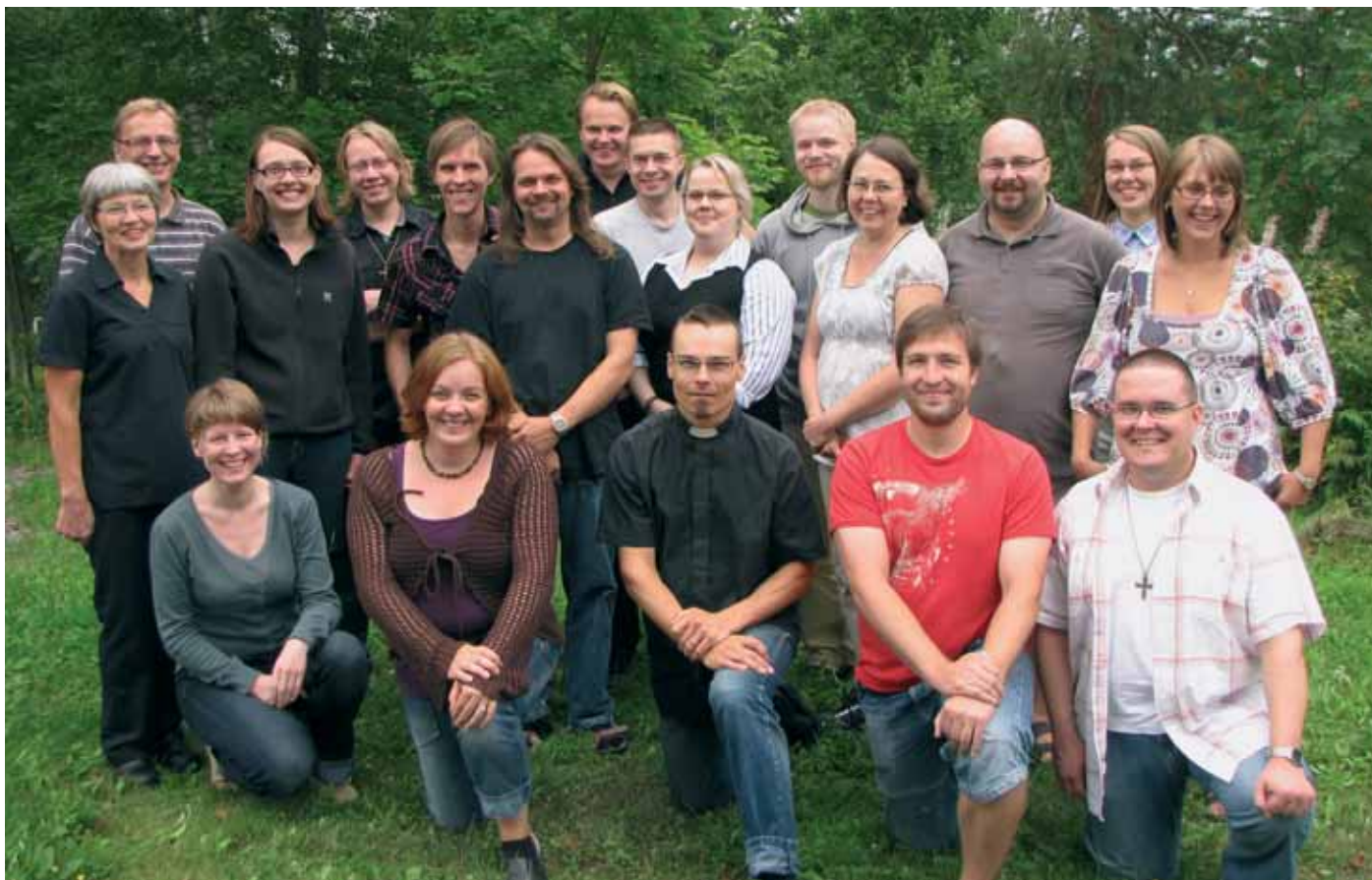
Työntekijäkokous leiri- ja kurssikeskus Enä-Sepässä Vihdissä 18.8.2010.