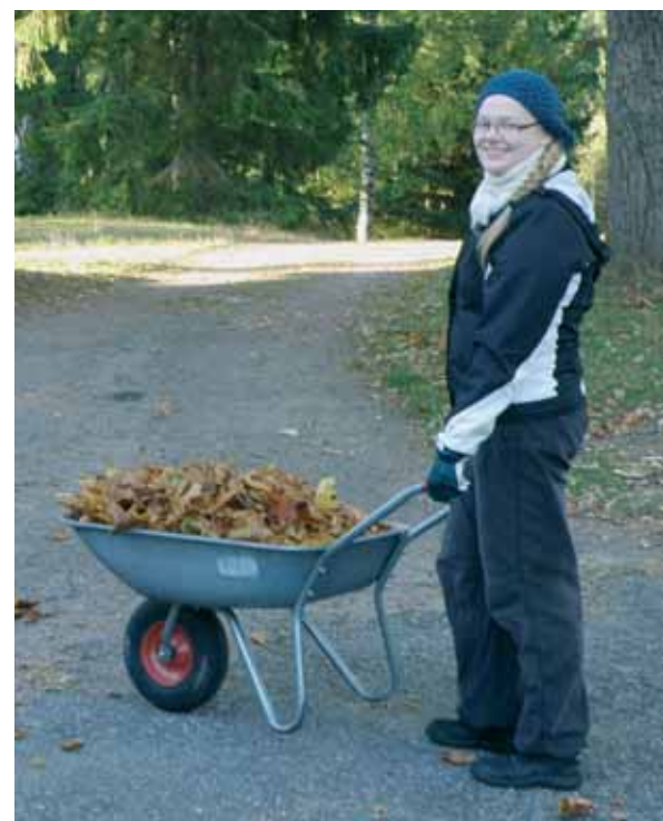
Kuvat: Ulkoleikkejä ja yhteislaulua kesäleirillä, piparkakkumyyjäiset jouluaerialla, talkootyötä syksyn Ora et laborassa.