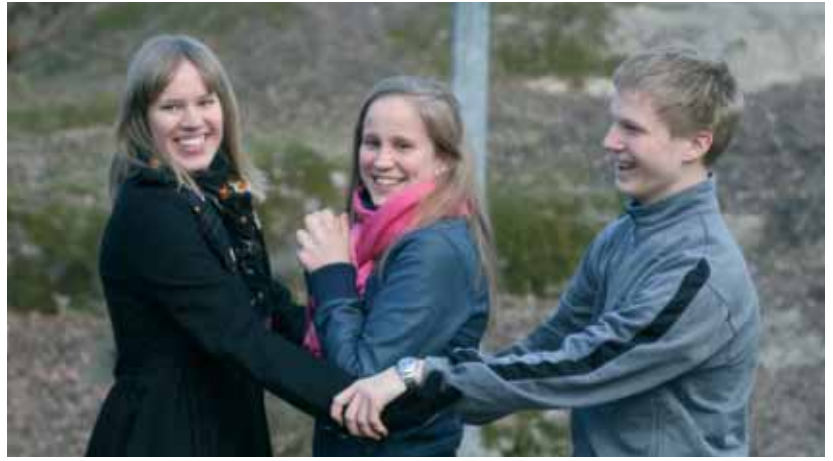
Alphakursens avslutningsfest i Helsingfors

per som finns i högstadier och gymnasier runt om i Svenskfinland, och vi saknade resurser för att kunna förverkliga detta.