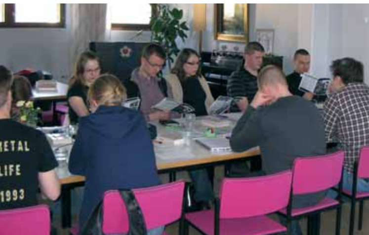
Vuosikokouksen työskentelyä Porissa maaliskuussa.

O PKOn hallinnon ylimpänä päättävänä elimenä on vuosikokous, joka nimitti strategista johtamista varten liittohallituksen. Valmistelua ja toimeenpanoa varten liittohallitus on nimittänyt työvaliokunnan ja ruotsinkielisen työn työvaliokunnan, Sarbuksen, joiden toimintaa täydentämään liittohallitus on kutsunut erilaisia neuvoa-antavia, valmistelevia ja keskustelevia toimikuntia ja tiimejä.