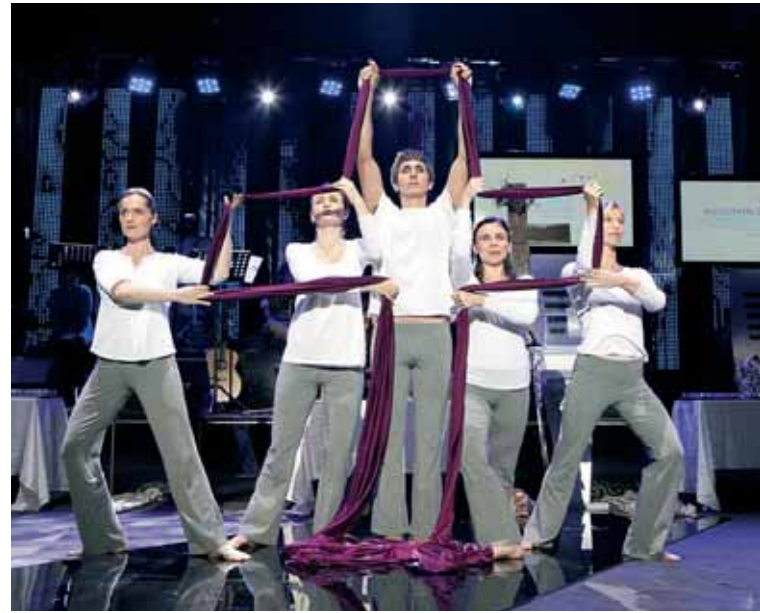
Performanssi IFESin maailmankokouksessa Puolassa kesä-heinäkuussa.

Suomesta osallistui neljä henkilöä IFESin maailmankokoukseen, joka järjestettiin Puolassa heinä-elokuun vaihteessa. IFESin Lähi-idän ja Pohjois-Afrikan aluekoordinaattori vieraili Suomessa alkuvuodesta, ja