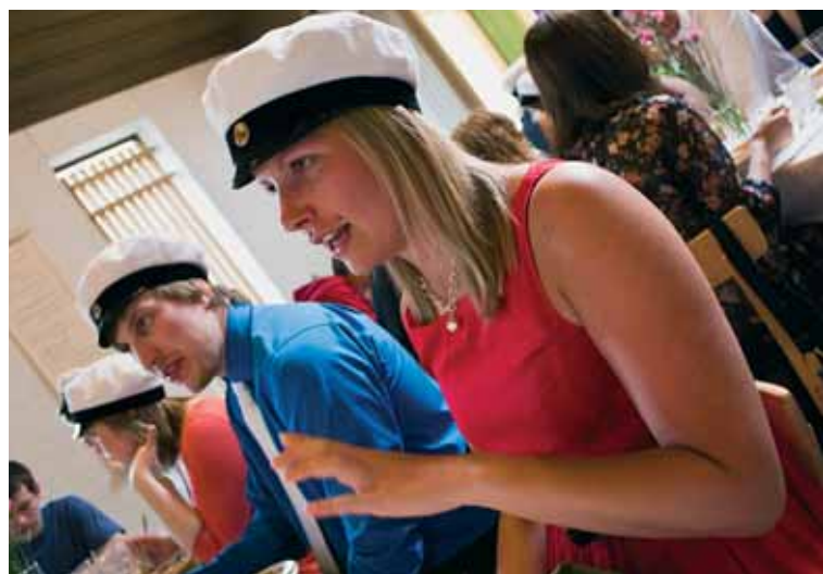
Vappfesten i Åbo.