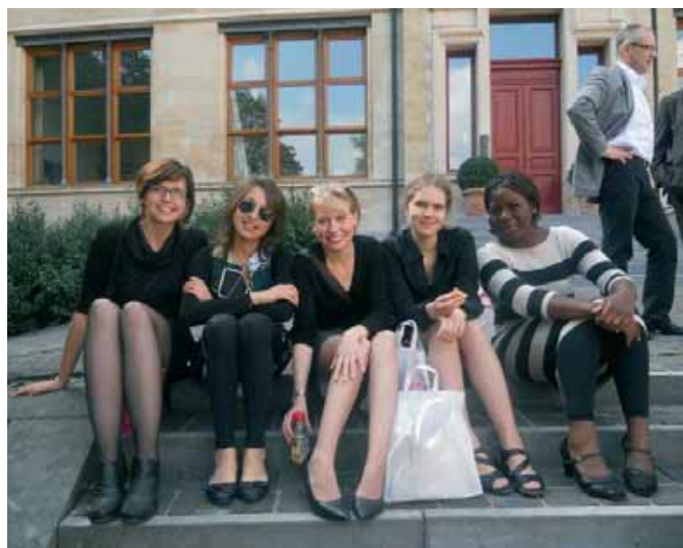
Deltagare i European Student Forum.

Vi deltog i de nordiska ledarmöten som ordnades. På våren skedde det i samband med en europeisk träff för generalsekreterare, som hölls i Moscia, Schweiz, och på hösten i samband med NOSA-konferensen i