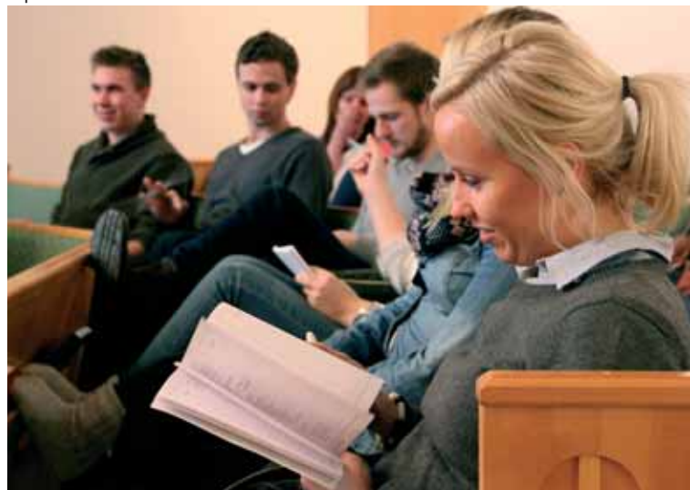
Alphakurs i Vasa.

Vi arbetade för att studerande efter avslutade studier skall ta ansvar i missionsarbetet också utanför landets gränser, och hade bla yttre mission som tema på våra samlingar. Vi informerade om en missionskonferens för unga vuxna som arrangerades av Finska missionsällskapet, samt gjorde reklam för den europeiska konferensen Mission-Net som hölls under nyåret 2011-2012 i Tyskland.